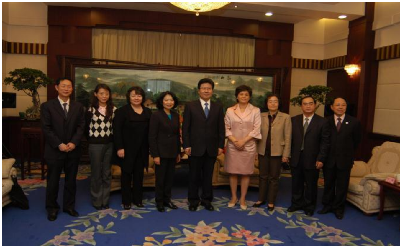
省委書記張春賢接見方黃吉文主席一行